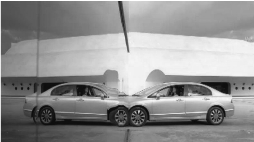
Figura 5. Fusão de imagens — sujeito e reflexo