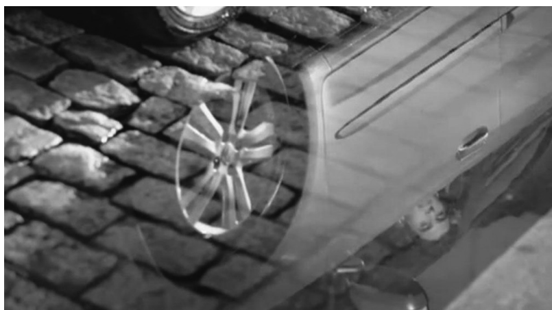
Figura 1. Cena final e síntese da proposta do filme —a contemplação da autoimagem— acompanhada da frase do locutor: “— É o que acontece quando se tem os proprietários mais satisfeitos do país”