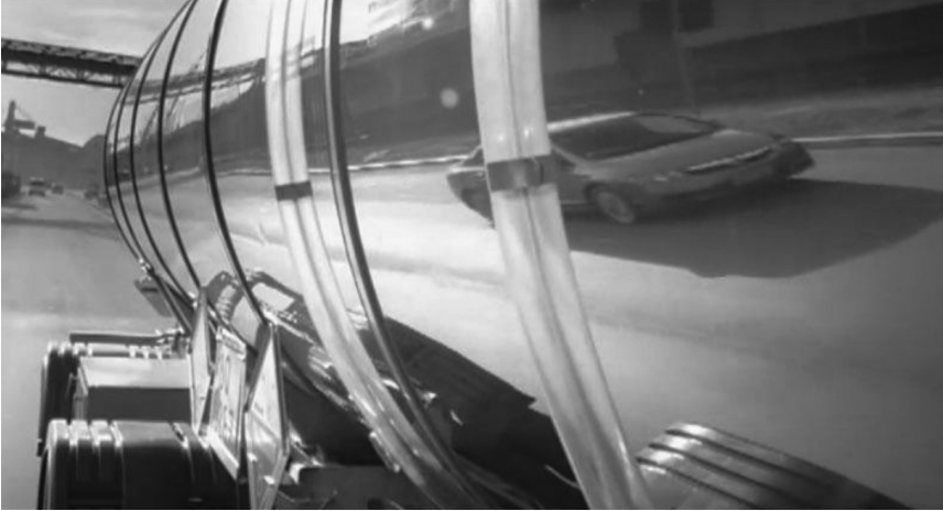
Figura 4. Contemplação do Eu na estrutura cromada do caminhão