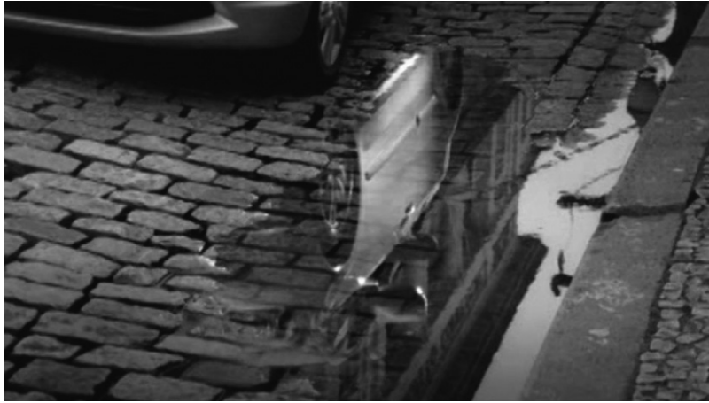
Figura 7. Início de enquadramento da cena final

Fonte: frame do filme Narcisos (F/Nazca, 2011).