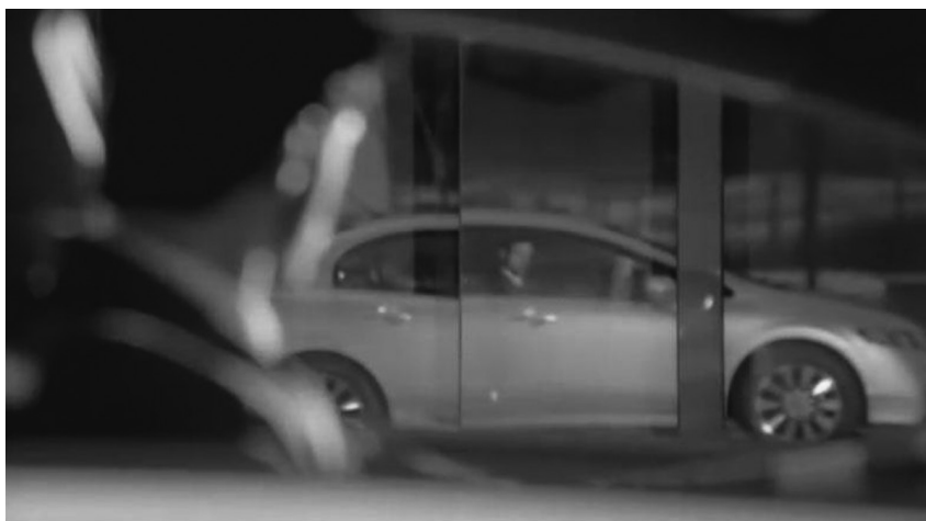
Figura 2. Contemplação do Eu na fachada espelhada