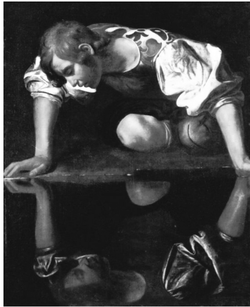
Figura 6. Narciso (1597-99), por Caravaggio

satisfeitos, os contempladores/consumidores de autoimagens no século XXI. Já em termos de forma, em praticamente todas as cenas, incluindo as que aparecem nas imagens apresentadas há pouco, são percebidos resquícios da representação clássica de Narciso, como sugere a obra de Caravaggio.