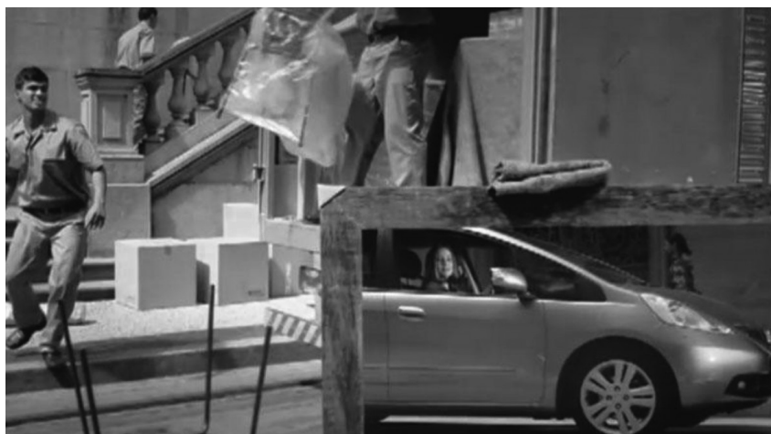
Figura 3. Contemplação do Eu no espelho