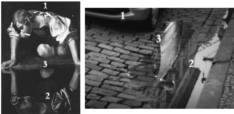
Figura 8. Regularidades intertextuais

A comparação entre as regularidades intertextuais das duas imagens podem ser mais bem observadas no esquema comparativo a seguir.